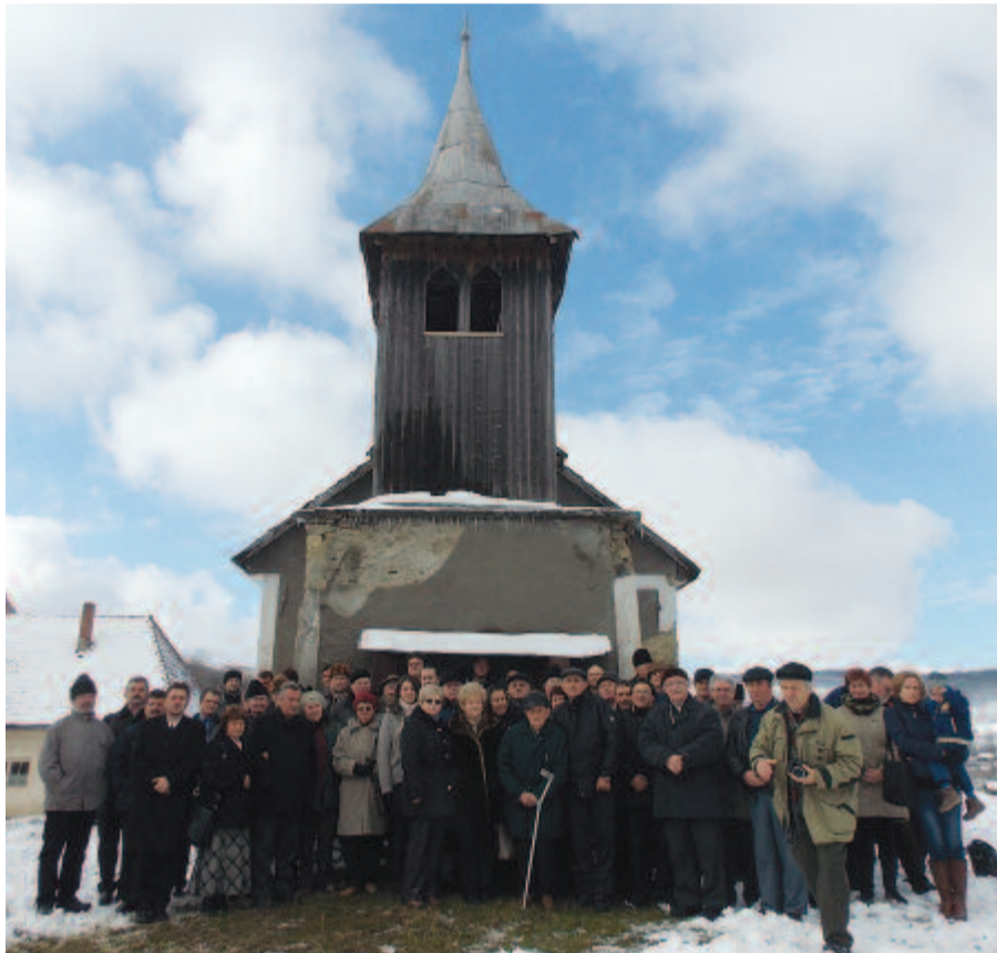
Az emlékező gyülekezet