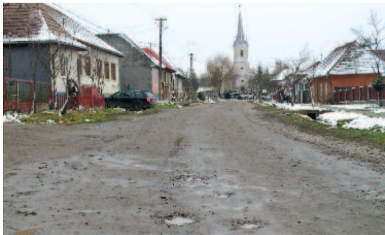
Hagymásbodon – aszfaltozásra várva

– Amikor a pályázatot benyújtottuk, a kormányzati program kiírásának egyik feltétele volt, hogy négy méternél ne legyen szélesebb az útszakasz, ezt be is tartottuk. Utólag a karácsonfalvi dombtetőn át vezető szakaszt kiszélesítettük aszfaltozott útpadkával, a hét végén hozzáfogtak az útpadka javításához. A terveink szerint a teljes összekötőutat ötméteresre szélesítjük, és még egy réteg aszfaltburkolatot húzunk rá. Egyébként azon az útszakaszon súlykorlátozás van érvényben, így